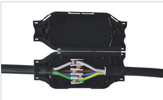
Mit der 280 x 117 x 49 Millimeter großen Gel-Muffe können jeweils drei Kabel mit einem Durchmesser von 18 bis 33 Millimetern verbunden werden. Werkfotos